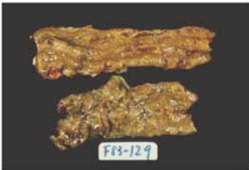
圖E 嚴重病例，可見黃色纖維素性壞死性偽膜輕覆在充血的小腸黏膜上。