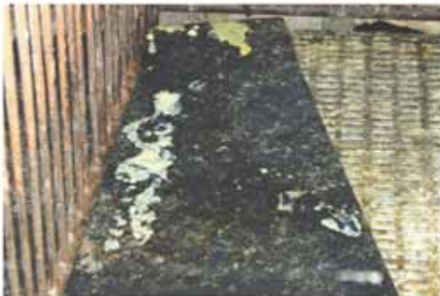
圖C 2週齡病仔排出的奶油色糞便至黃色下痢硬。