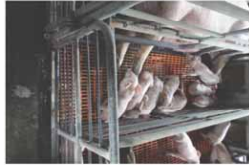
圖B 哺乳仔豬排出淡黃色水樣下痢，持續4~6天。