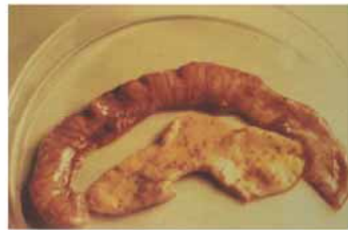
圖D 空腸與迴腸呈輕度至嚴重的壞死性腸炎。