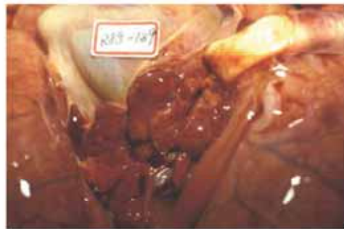
圖F 肺門淋巴結腫大、出血、壞死。