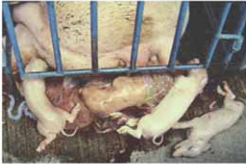
圖A 懷孕母豬流產是弓蟲感染引發的典型臨床症狀。