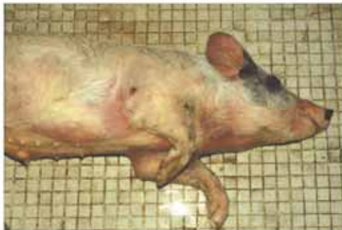
圖C 斃死豬耳翼呈紫色，體表有紫紅斑。