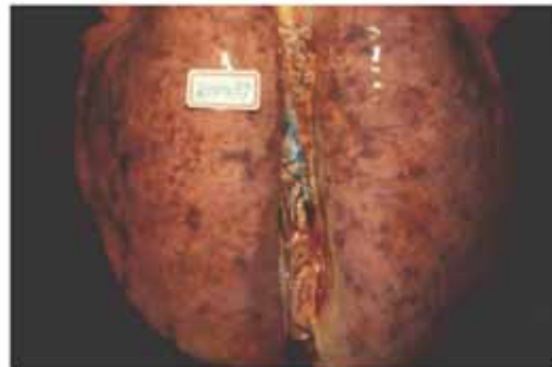
圖D 肺臟充血、水腫與密發細小白色壞死點。