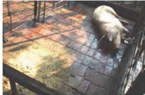
圖B 懷孕母豬流產後食慾廢絕、虛弱、精神甚差、躺臥。