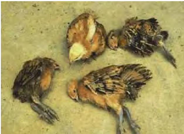
2-4-1 三至四週齡的小雞，臨床上呈現不同發病階段的神經症狀；有第二階段的精神呆滯、嗜眠；頭部及頸部呈間歇性震顫、晃動。重度感染的病雞，則側臥站立不起。