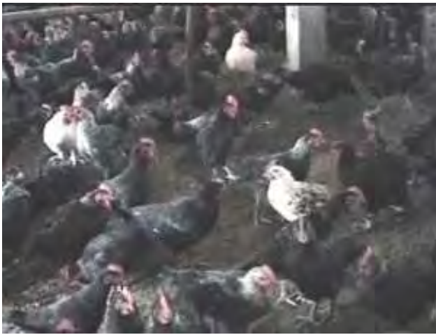
2-8-1 部分 14 週齡仿土雞因罹患病毒性關節炎，導致雞群整齊度差而影響上市銷售。