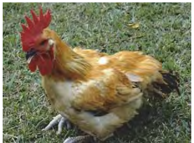
2-8-2 參差不齊的雞群中，罹病雞隻呈跛腳或站立困難，因生長停滯而呈現瘦小及體重不足。