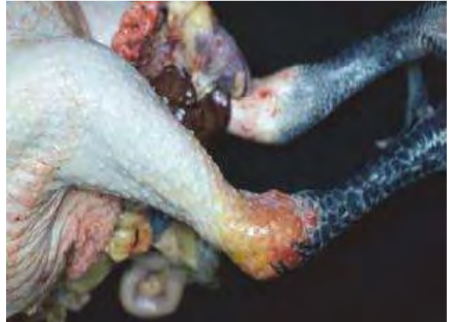
2-8-6 屠體右腿的跗關節明顯比左腿腫大，陳舊出血灶呈黃色至紅色。