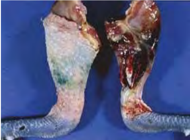
2-8-5 覆蓋在腓腸肌腱表面的皮膚呈暗紫色澤。剖開病灶區的皮膚，可發現腓腸肌腱明顯腫大或斷裂，並伴隨嚴重皮下出血。