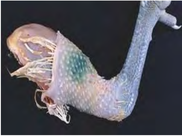
2-8-3 罹病雞膝關節上端皮膚腫脹，且呈暗綠色澤。本病灶係因皮下出血，而導致血綠素釋出沈著於皮下組織的變化。本圖是雞病毒性關節炎的病例。