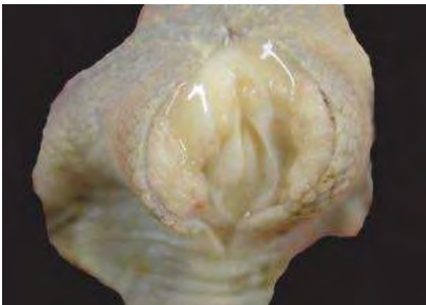
3-4-5 葡萄球菌性關節炎。膝關節及周圍組織腫脹，剖檢可見乳油膠樣物蓄積於滑液膜囊腔中。從滑液膜囊腔進行病原分離，常可分離出 Staphylococcus aureus 。