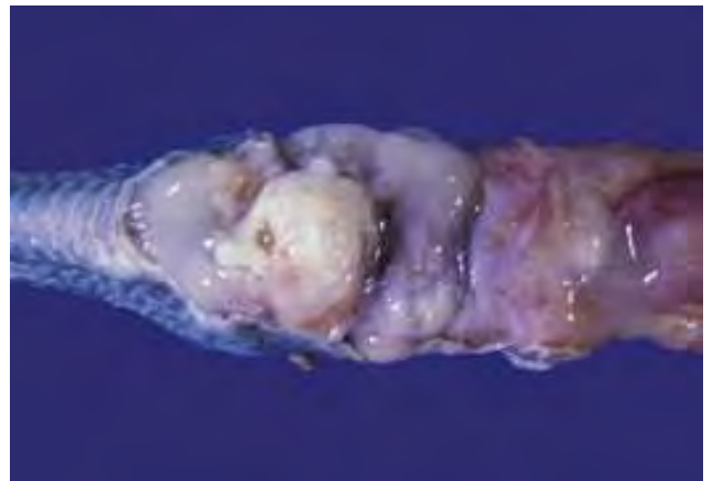
3-4-4 關節囊腔中有多量淡乳黃色纖維素性滲出液，滑液膜增厚和水腫。