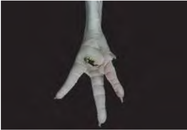
3-4-7 蹠墊腫大呈球形，中央部位較硬，呈褐色且粗糙並形成痂皮。趾瘤症是因外傷繼發細菌感染，經長期持續刺激後，結締組織增生修補所導致。