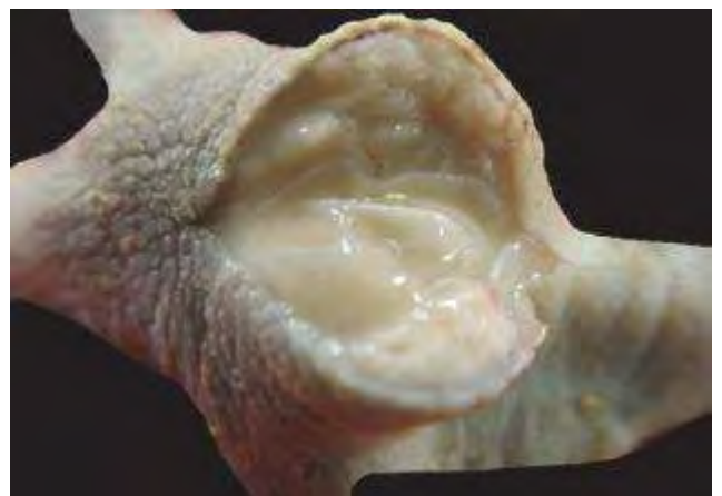
3-4-6 腫脹的趾蹠部有乳油樣凝膠物蓄積，是化膿性葡萄球菌性關節炎常見的病變。