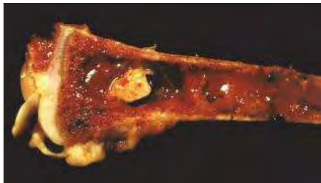
3-4-11 股骨或脛蹠的近側端，亦常發生骨髓炎。