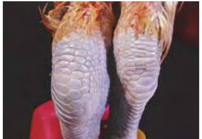
3-4-2 近觀常可見病雞脛關節、肘關節或趾關節等腫脹而發炎，與正常關節(右)呈鮮明對比。