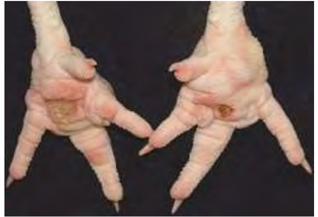
3-4-8 雙側蹠墊(或稱爪墊)各有大小不一的潰瘍灶，上覆痂皮經屠宰過程而脫落。趾瘤症好發於成雞，尤其是體重較重的品系。