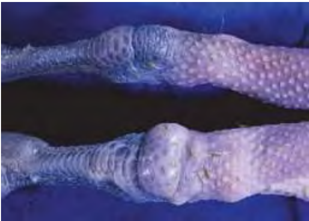
3-4-3 葡萄球菌性關節炎的關節(下)較正常關節(上)明顯腫脹。