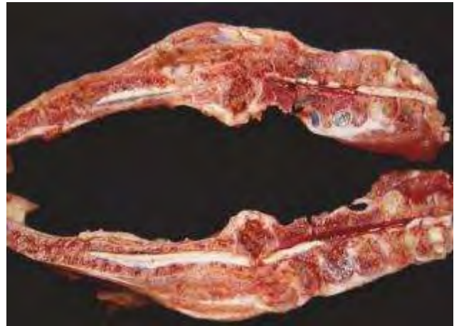
3-4-10 剖檢偏癱或麻痺病雞，可見第五至第七胸椎椎體有膿瘍形成，伴隨骨外膜與骨髓炎。