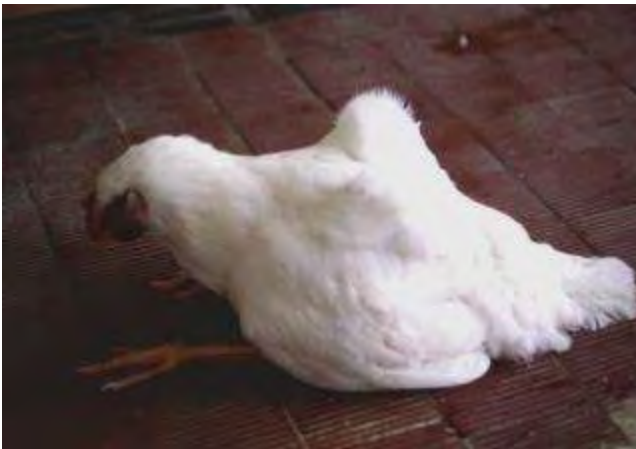
3-4-9 本病亦會造成病雞的脊髓炎與骨髓炎，病變會壓迫脊髓而造成偏癱或麻痺。