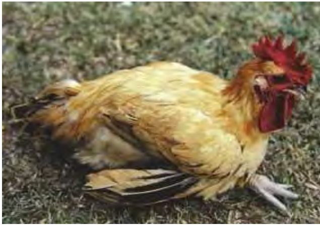
3-4-1 十週齡仿土雞因罹患化膿性關節炎而站立不起。