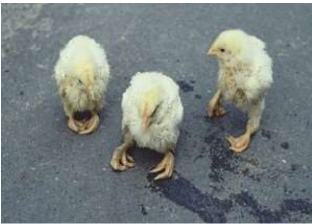
5-3-1 ~ 2 典型 Vit-B2 缺乏症的病雞，其特徵是病雞雙側腳趾向內側捲曲，或呈握拳頭狀或劈腿狀。