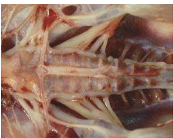
5-3-4 雙側坐骨神經明顯腫大清晰可見。本病灶是 Vit-B2 缺乏的特徵性病變。需與馬立克病引發的單側性坐骨神經腫大進行區別。