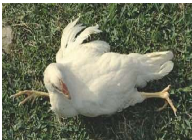
5-3-3 罹病雞站立困難呈現劈腿或腳趾握拳狀。